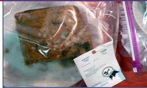
"Pan Mohoso, 3er lugar" de Benimoto esta certificado bajo CC BY 2.0